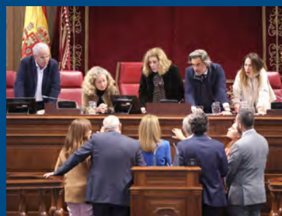
Pleno en imágenes