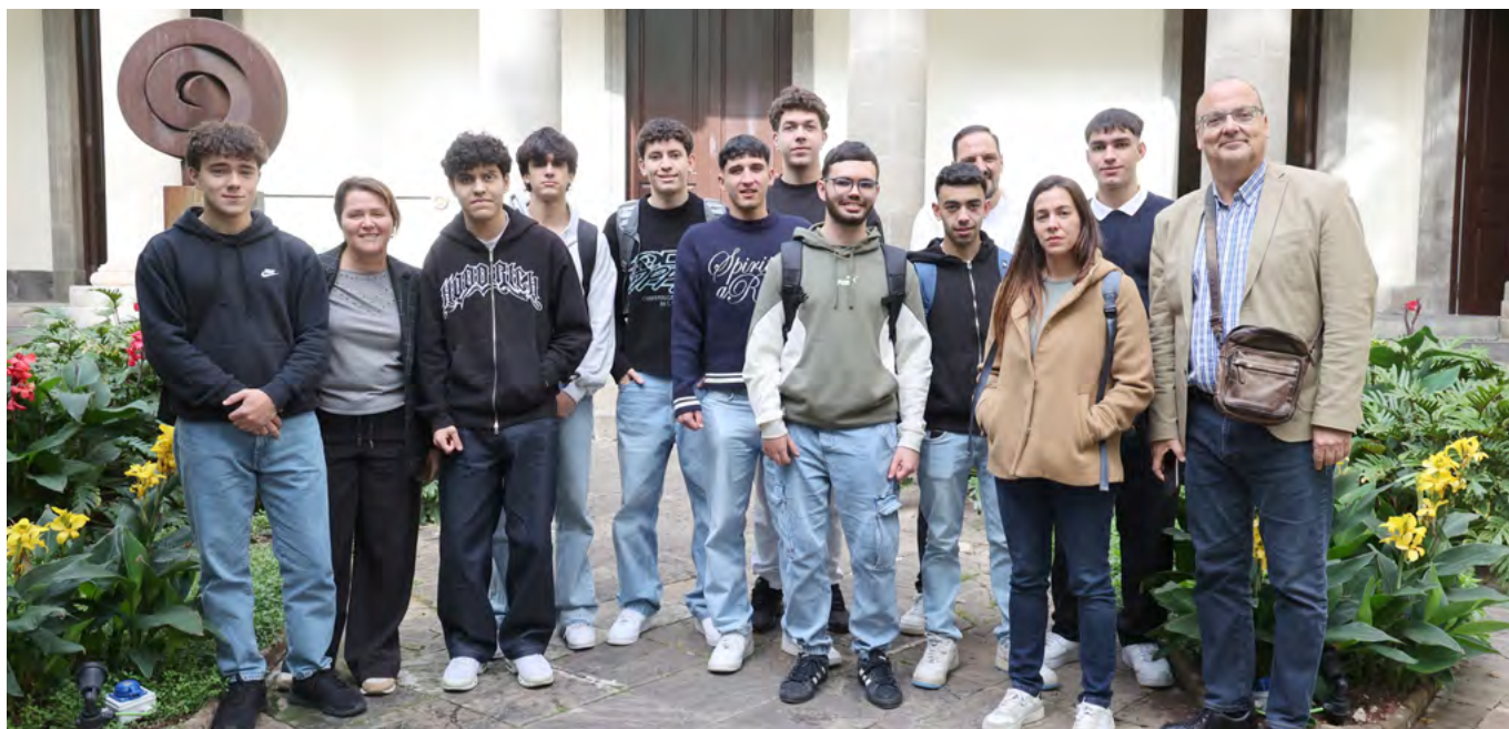
IES Las Breñas, Breña Baja, La Palma