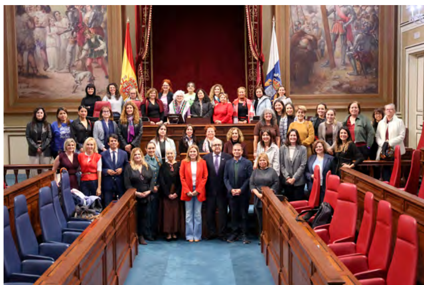
“Las que cuidan, las que atienden, las que limpian. Mujeres en el sector servicios en Canarias”