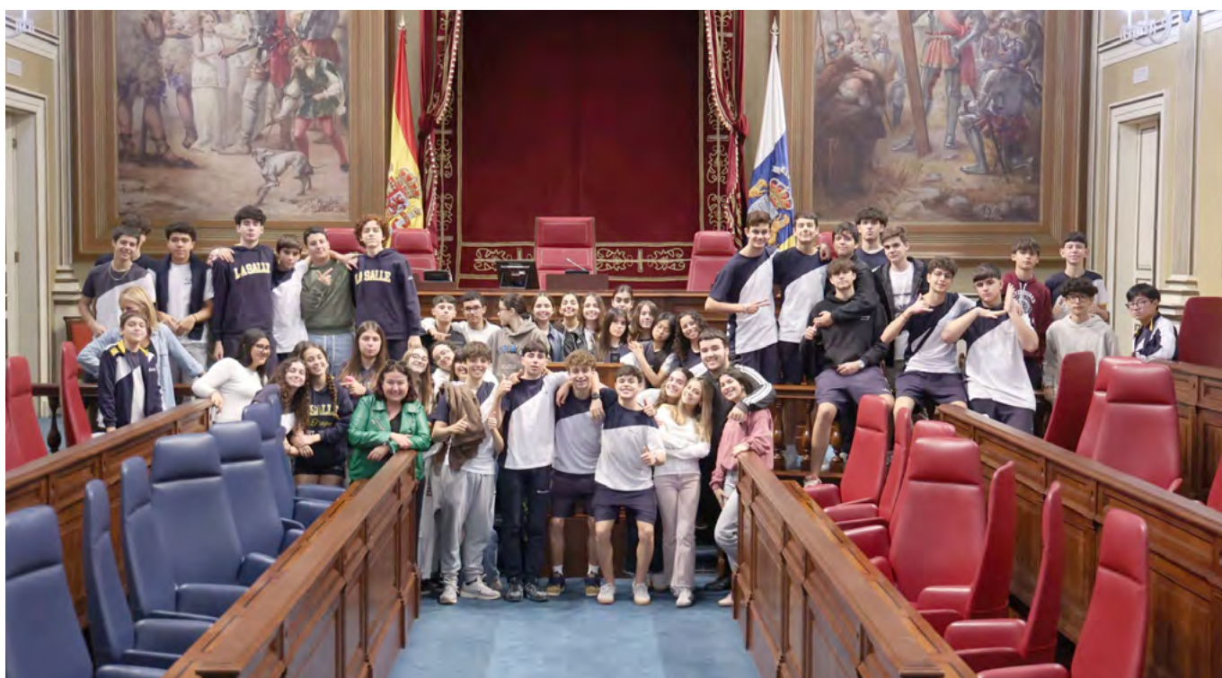
Colegio La Salle San Ildefonso, Santa Cruz de Tenerife