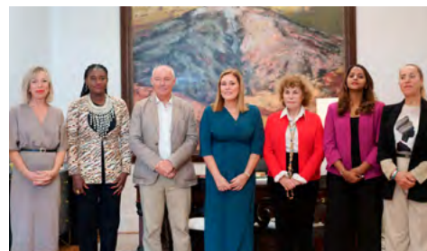
“Mujer y Parlamento: la voz de África es femenina”