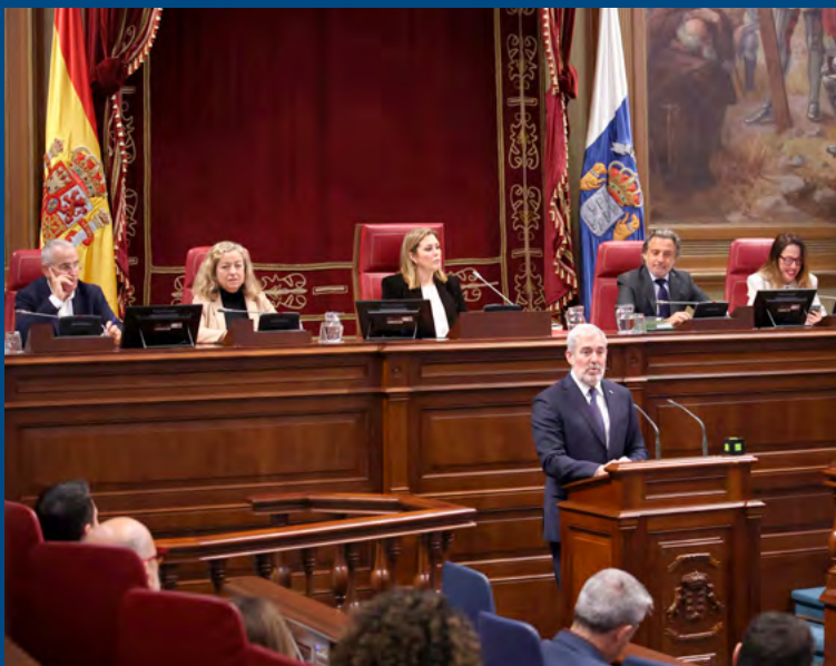
Debate General sobre el Estado de la Nacionalidad Canaria